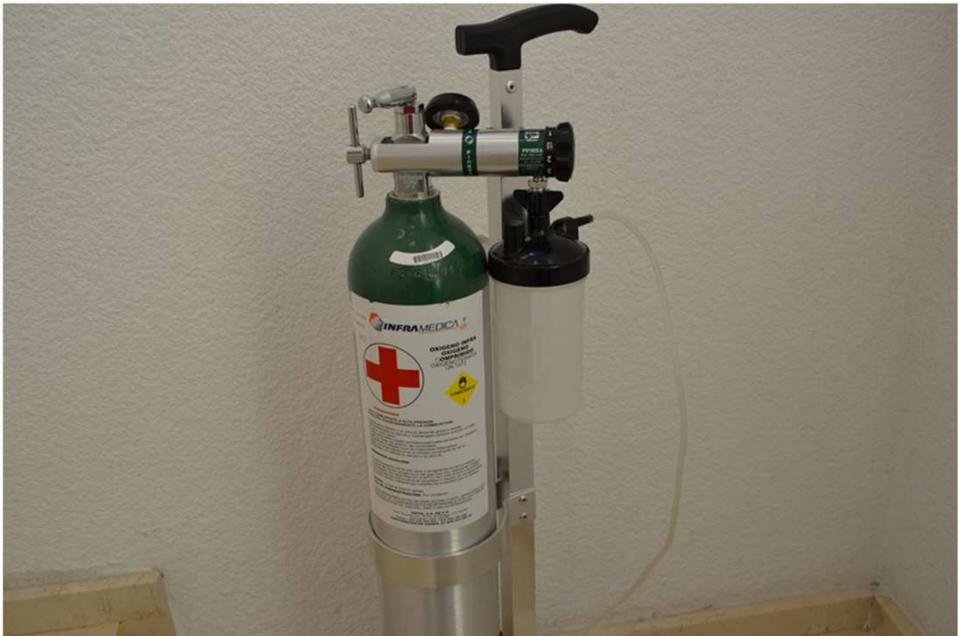
Fig. 10 Tanque de oxígeno