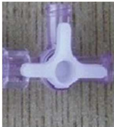
Fig.3 Llave de tres vías