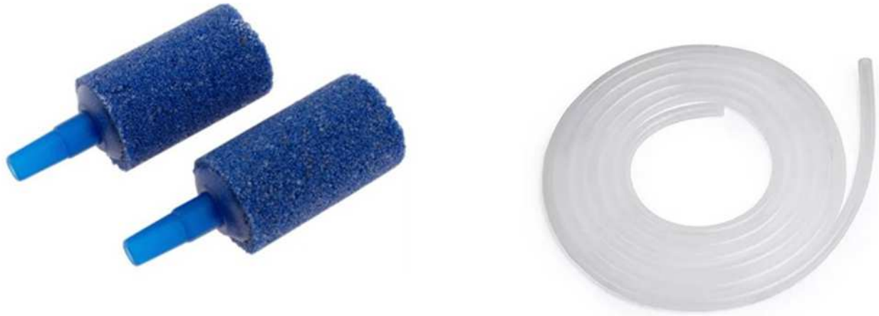
Fig.4 Difusores y mangueras