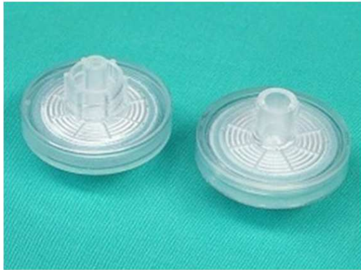
Fig. 2 Microfiltro biológico