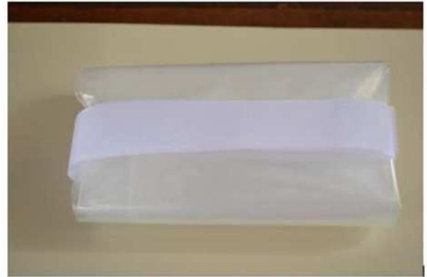
Fig.7 Bolsa para pie diabético