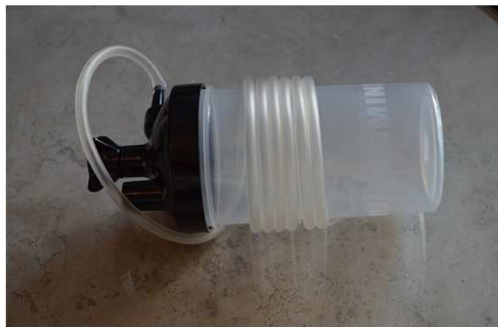
Fig.1 Vaso liberador de presión con manguera