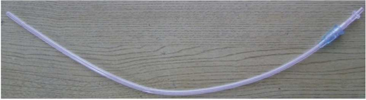
Fig. 6 Sonda de nélaton