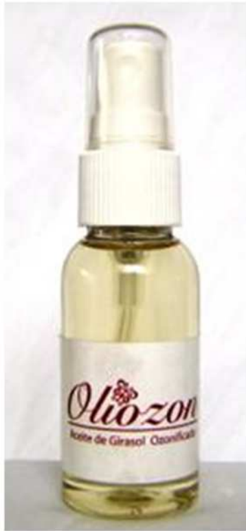
Fig. 9 Aceite de Girasol