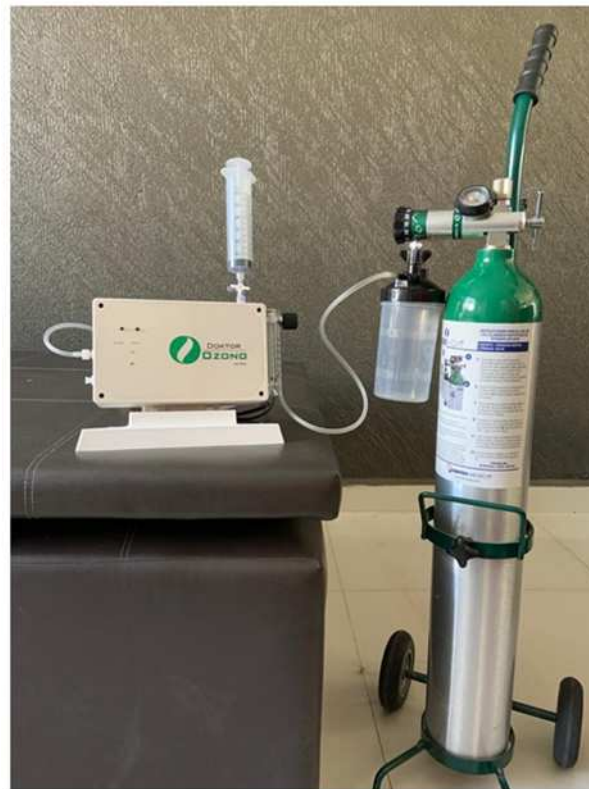
Fig. 8 Equipo armado con tanque